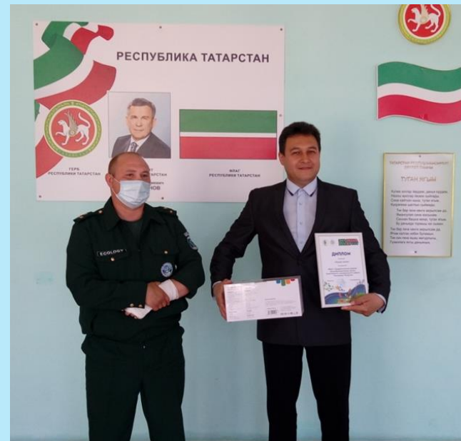
РЕСПУБЛИКАНСКИЙ КОНКУРС ЭКОВЕСНА 2021, ДИПЛОМ "ЛУЧШАЯ ШКОЛА"